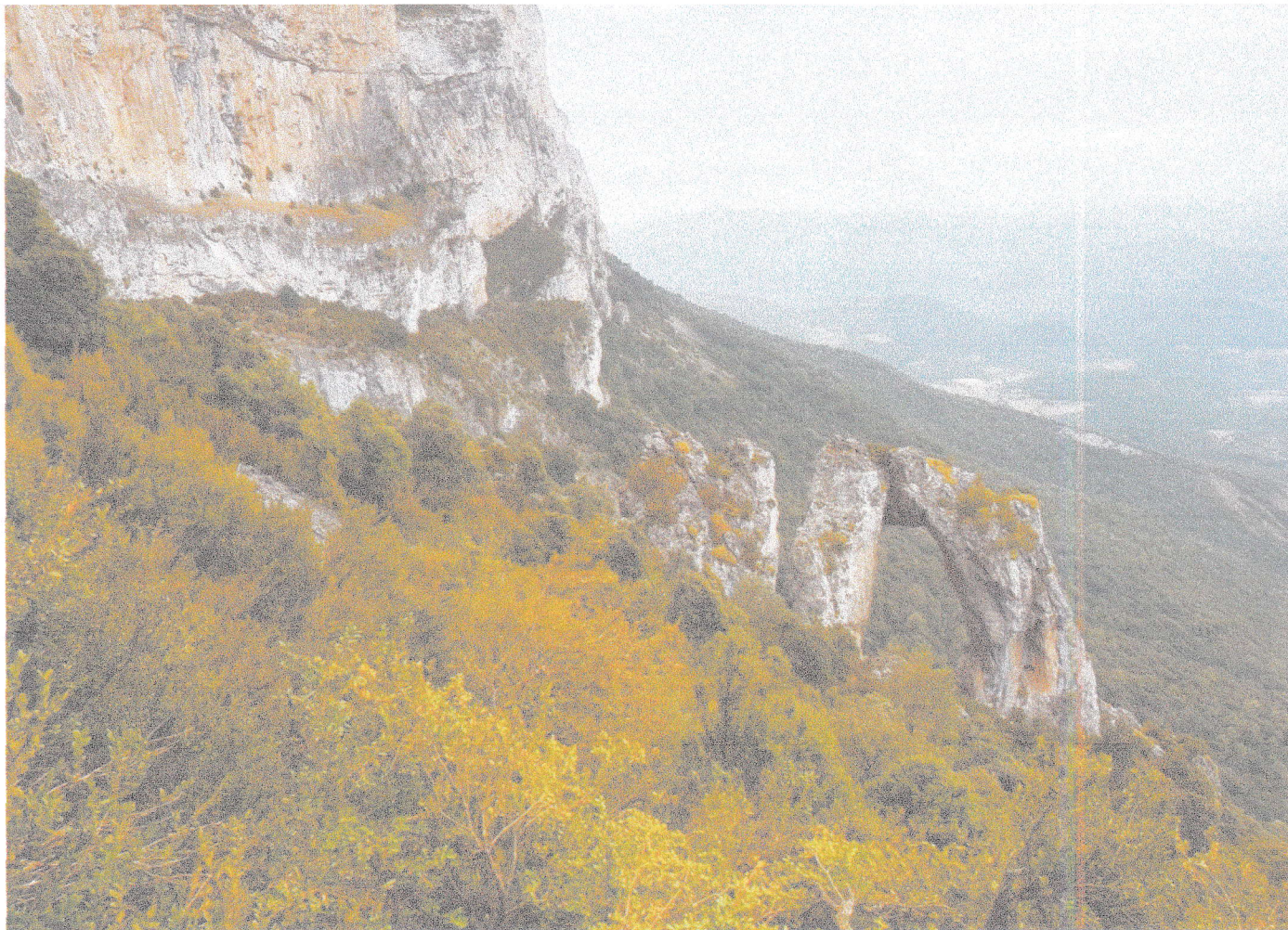
Arco natural "La Portaza"