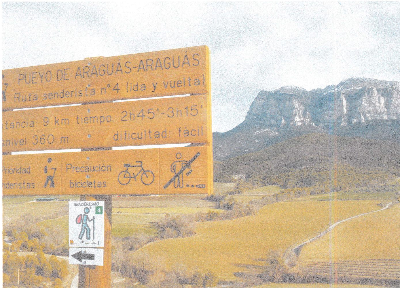
Rutas señalizadas en 2017