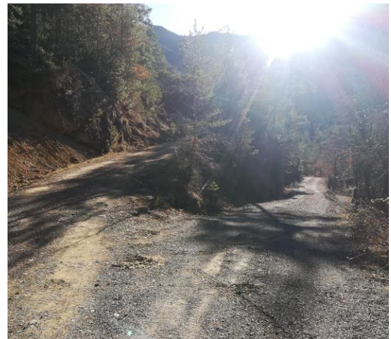
Desvío San Salvador dcha, Collado Fenés izq