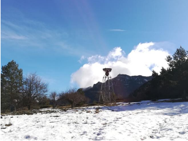
Collado de Fenés

de Petralba y nos enlazará con el recorrido nombrado antes, en la pista de San Salvador. Otra opción sería descender por el PR que unía antiguamente Fiscal, con la zona de Sobrepuerto, en concreto con Fanlillo.