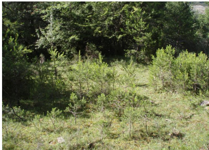
Detalle del estado de la masa en Cuchioplán

camino circular que recorre las dos vertientes del río hasta Ligüerre. Este hecho puso de manifiesto la importancia de estos trabajos de silvicultura para asentar población, para poder ofrecer a los habitantes de nuestros pueblos una alternativa de vida, compatible con el intenso trabajo en el sector servicios durante la época estival, así como disponer de mano de obra que mantenga los montes limpios, que practique una silvicultura preventiva, tan importante en nuestros días y que evite tener carga de material que pueda dificultar las labores de extinción, en caso de un incendio forestal.