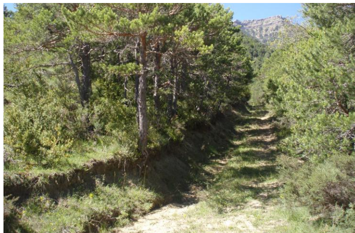
Pista de Picarizas