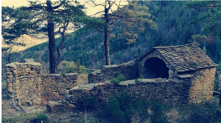
Ermita de San Salvador

encuentra en un precioso enclave, rodeado de hayas, al cual se puede acceder por pista forestal y que dispone de dos mesas de madera ideales para pasar el día en familia.