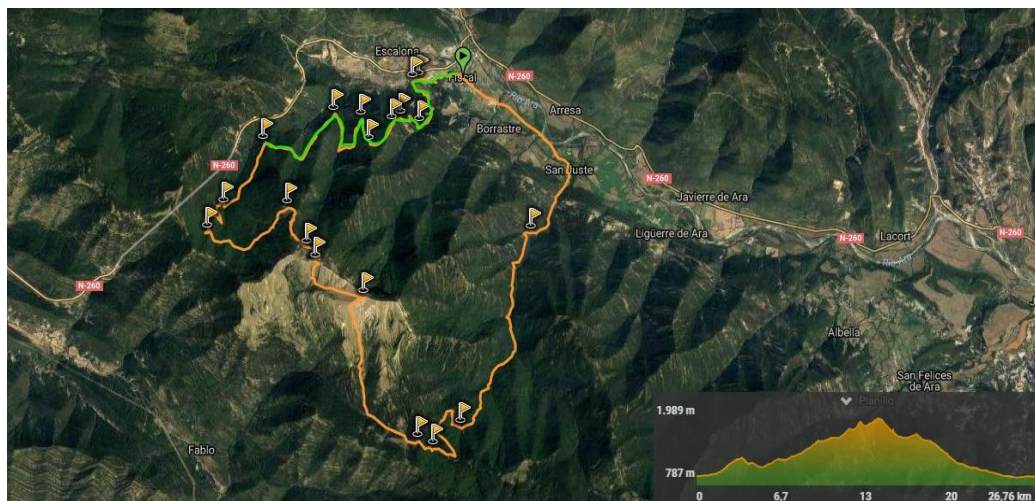
Detalle en verde del nuevo recorrido dentro de la Carrera de Canciás, en naranja