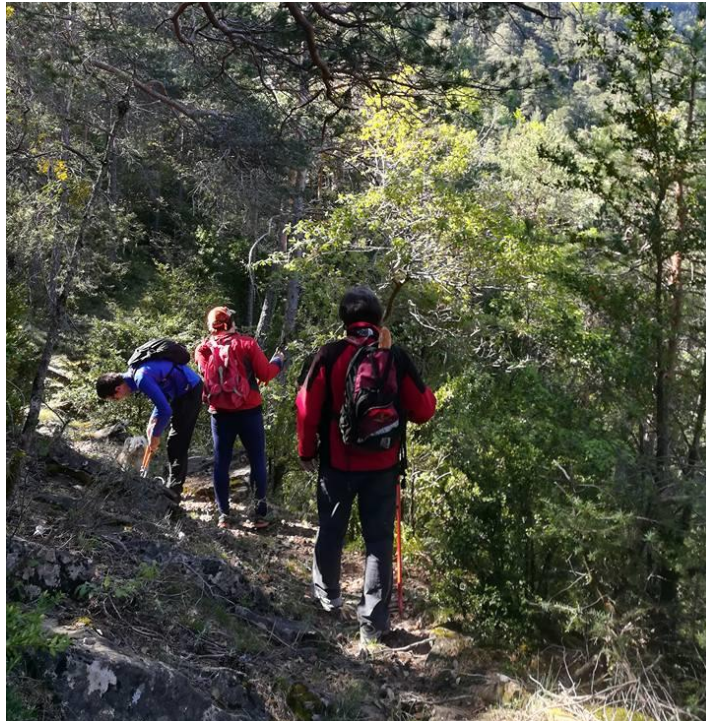
Detalle limpieza camino Cuchioplán

El año pasado se realizó, de forma voluntaria, la limpieza de dicho trazado, pues discurre en su mayor parte por antiguas trochas de saca de madera que se encontraban muy emboscadas. Actualmente el estado es bueno, siendo necesario su marcaje. Para ello se usarán dos tipos de señales, para senderistas y para BTT.