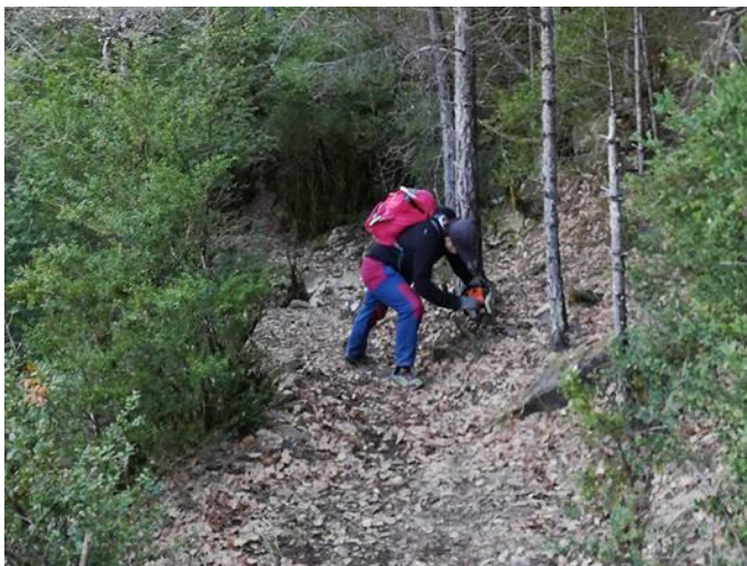
Detalle de nuestros voluntarios trabajando

Para la realización de estos objetivos, se cuenta con la mano de obra voluntaria de los socios del Club Peña Canciás, pero es necesario el material y las herramientas para señalizar.